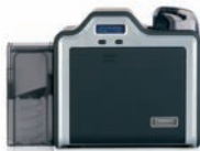
Kartendrucker/Kodierer für einseitigen Druck