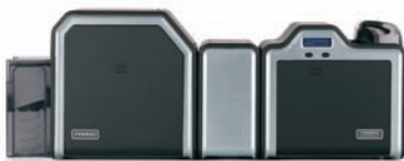
Laminiereinheit und Kartendrucker/Kodierer für beidseitigen Druck