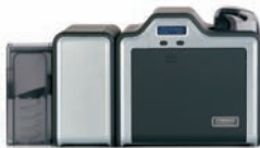
Kartendrucker/Kodierer für beidseitigen Druck